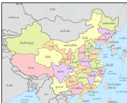
แผนที่สาธารณรัฐประชาชนจีน