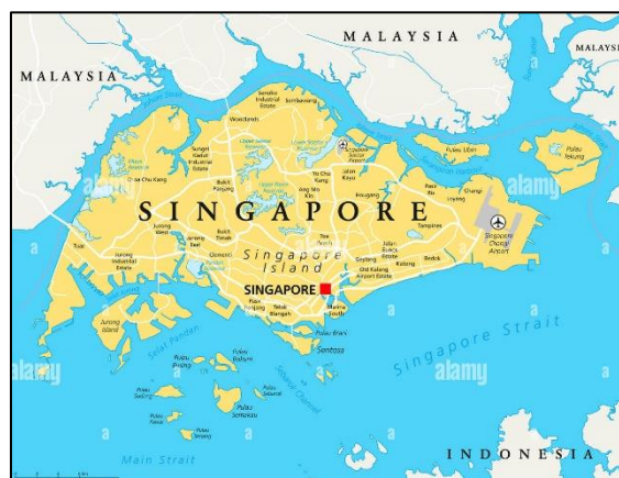
แผนที่สาธารณรัฐสิงคโปร์