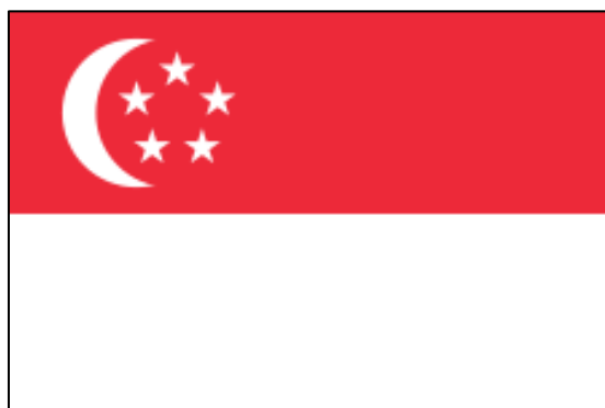
ธงชาติสาธารณรัฐสิงคโปร์