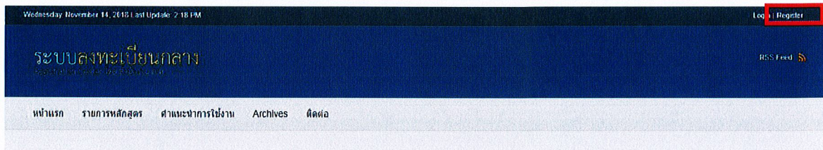
ภาพประกอบที่ ๑