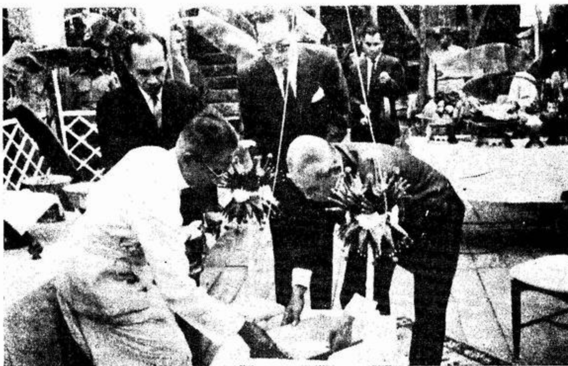
๑ พล.๑ นายกรัฐมนตรี ประกอบพิธีวางศิลาฤกษ์