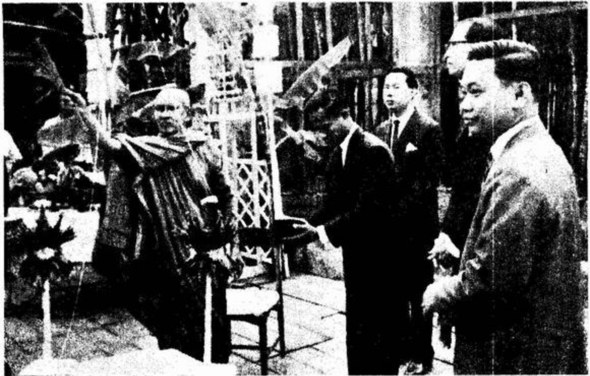
สมเด็จพระสังฆราช ทรงประพรมน้ำพระพุทธมนต์