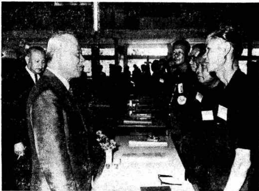
จอมพล ถนอม กิตติขจร หัวหน้าคณะปฏิวัติ กำลังสนทนากับผู้นำสถาบันเกษตรกร หลังจากได้กล่าวคำปราศรัยเปิดการประชุมแล้ว

ข้อ ๕. ข้าพเจ้าจะนำเอาความรู้ที่ได้รับในการประชุม ซึ่งทางรัฐบาลได้หยิบยื่นให้ครั้งนี้ ไปเผยแพร่แก่สมาชิกสถาบันเกษตรกร ตลอดจนพี่น้องร่วมอาชีพทั้งหลาย เพื่อประโยชน์ในการเพิ่มผลผลิตให้ ได้ผลตามนโยบายของรัฐบาลทุกประการ”